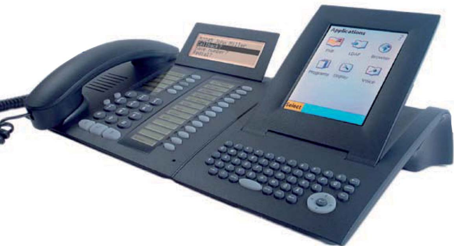
optiPoint 420 advance + модуль приложений optiPoint

Индивидуальные решения, отвечающие всем специальным требованиям