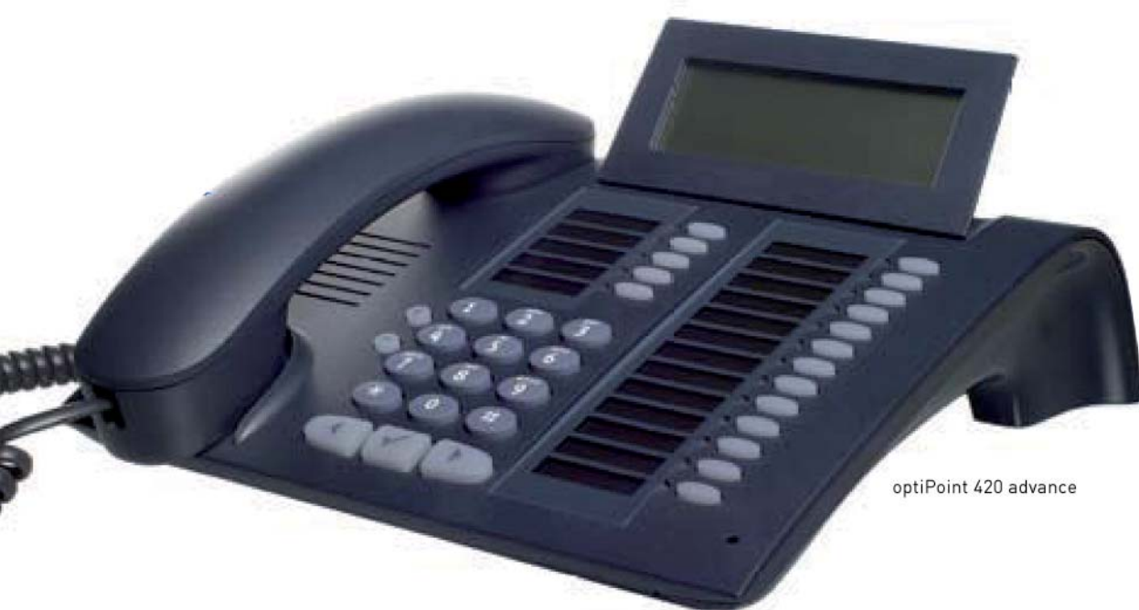
optiPoint 420 advance